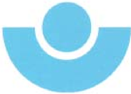
Arbeitsgemeinschaft der Bau-Berufsgenossenschaften